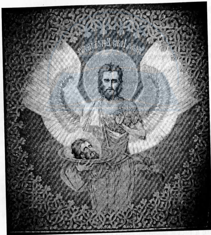
Sfântul Ioan Botezătorul, Biserica Drăgănescu.