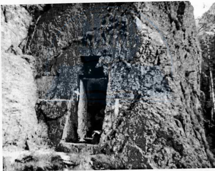
Chilia Părintelui Arsenie, Munții Făgăraș